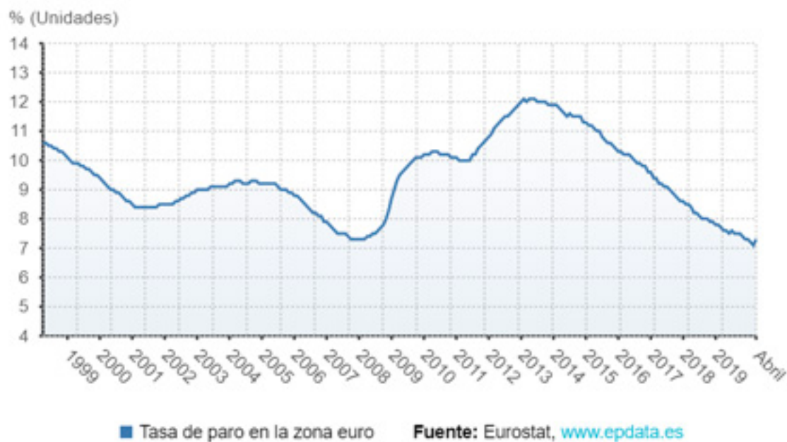
Imagen 3. Paro en la Eurozona.

[Imagen recortada de https://m.europapress.es/economia/laboral-00346/noticia-paro-eurozona-mantiene-75-frente-141-espana-20200109111611.html ]