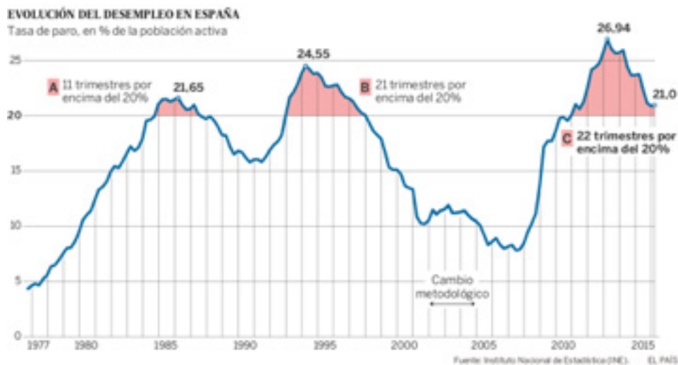
Imagen 4. Paro en España.